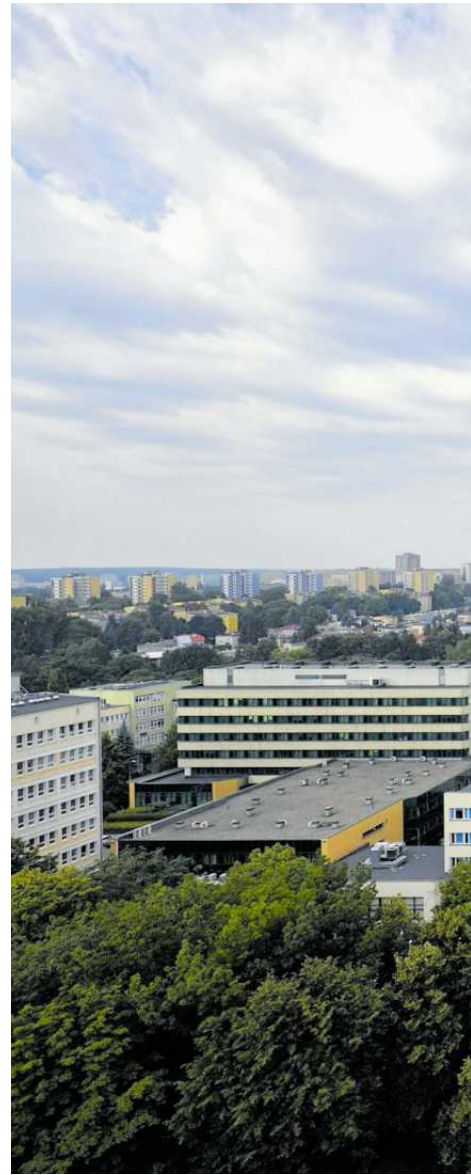
• Rektorat UMCS, w tle miasteczko akademickie