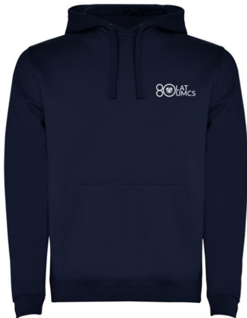
JHK SWRA KNG