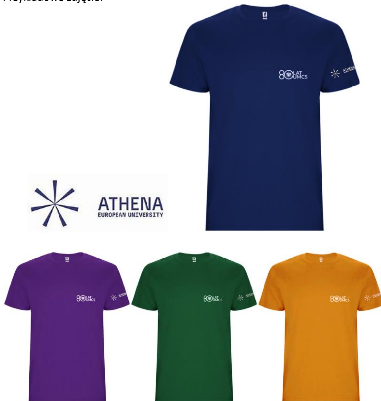
JHK TSRA 190