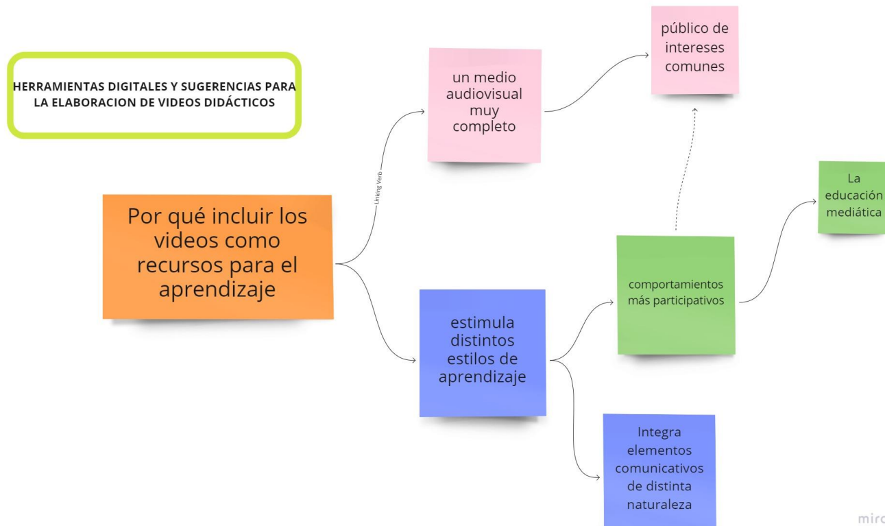
Mapa 1. Razones positivas por las que incluir videos como recursos para el aprendizaje en educación