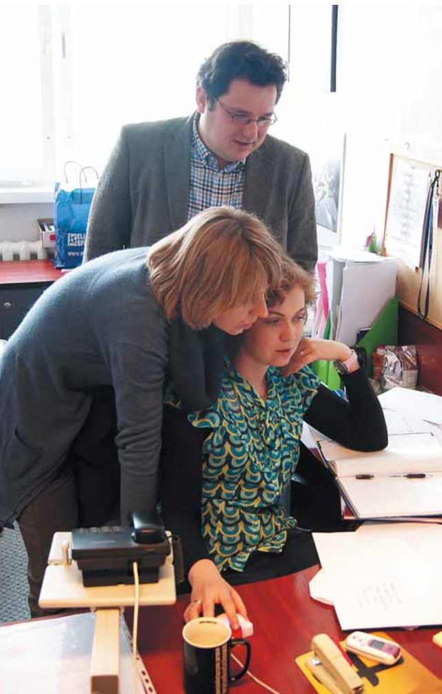
Zespół Informacji i Promocji przy pracy

Stworzyliśmy taką ofertę programową, by każdy ze studentów mógł wybrać te możliwości, które idealnie mu odpowiadają, pasują do jego wymarzonej ścieżki kariery. Między innymi dlatego prezentujemy wachlarz możliwości, także dla ambitnych studentów. Mogą studiować w języku angielskim, zwiedzić świat dzięki wyjazdowi zagranicznym, praktykom, wymianom studenckim na polskie i zagraniczne uniwersytety. Akademicki Ośrodek Sportowy daje szansę realizacji sportowych pasji. Działający przy UMCS Akademicki Związek Sportowy co roku znajduje się w czołówce uniwersytetów, rywalizując w Mistrzostwach Akademickich. UMCS proponuje różnego rodzaju programy kulturalne realizowane przez Akademickie Centrum Kultury „Chatka Żaka”. Studiowanie daje możliwość aktywnego włączenia się w życie Uczelni, w procesy ciągłych zmian, jakie w niej zachodzą. (ms)