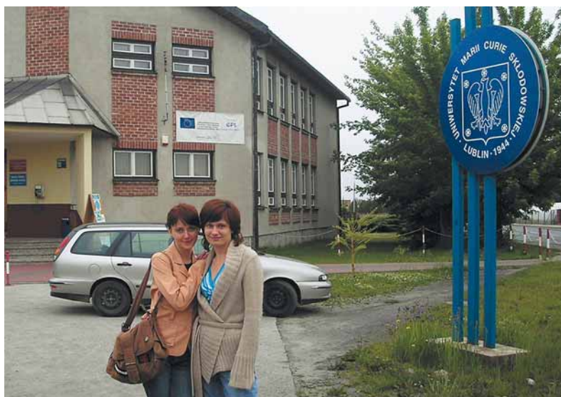
Kolegium Licencyjne UMCS w Białej Podlaskiej

z dodatkową specjalnością logopedyczną); informatyka; politologia (specjalność administracja publiczna); stosunki międzynarodowe.