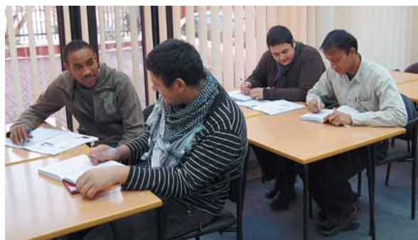
W Centrum uczą się osoby polskiego pochodzenia i cudzoziemcy