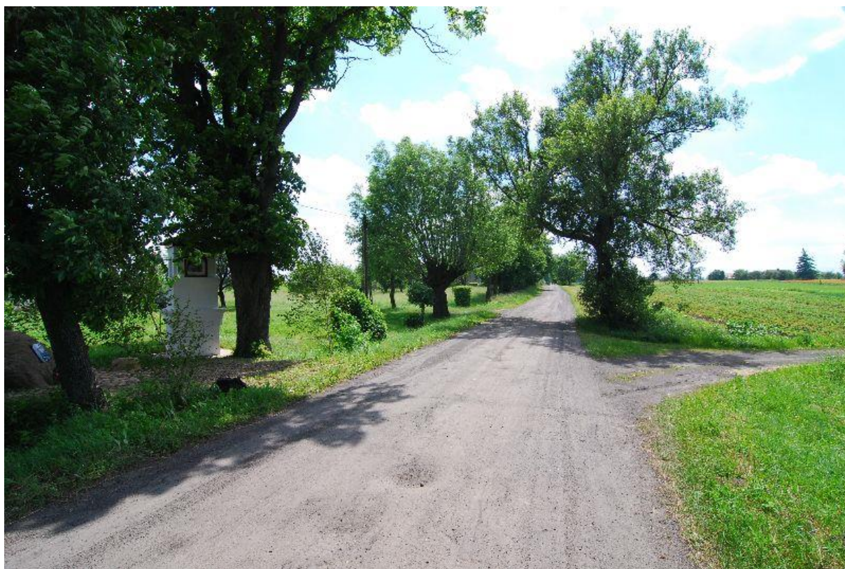
Ilustracja 23. Niebrukowana droga od wsi do wsi i droga przez pole (Hańsk, powiat włodawski).