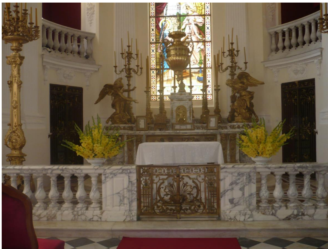
Ilustracja 8. Balustrada oddzielająca ołtarz od reszty kościoła (Kaplica pałacowa Zwiastowania Najświętszej Marii Panny – Muzeum Zamojskich w Kozłówce, powiat lubartowski).

Balaski to w dawnych kościołach były przed ołtarzem (Hosznia Ordynacka). Balaski to jakby taka barierka w kościele odgradzająca wiernych od ołtarza (Chmiełek). Balaski po boku, a pośrodku wejście pod ołtarz jest (Ciechomin). Balaski to jeszcze w starych kościołach były (Żółkiewka). Dzieci to przy tych balaskach się gromadziły, bo to było najbliżej ołtarza, ale odgródzone jakby od niego (Opoczka Mała).