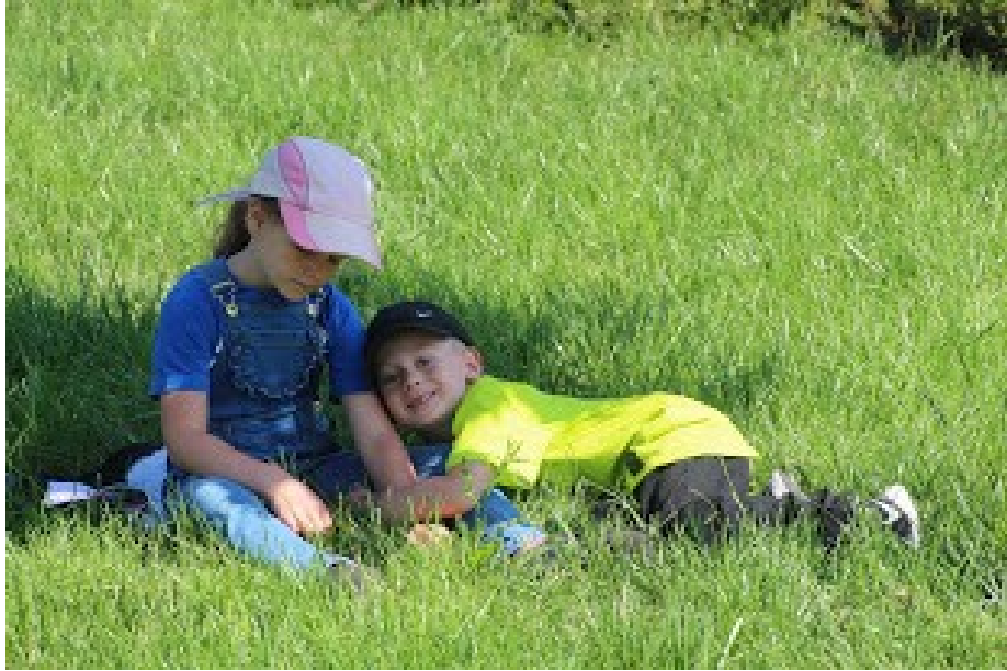
Mieszkańcy Markuszowa i okolic