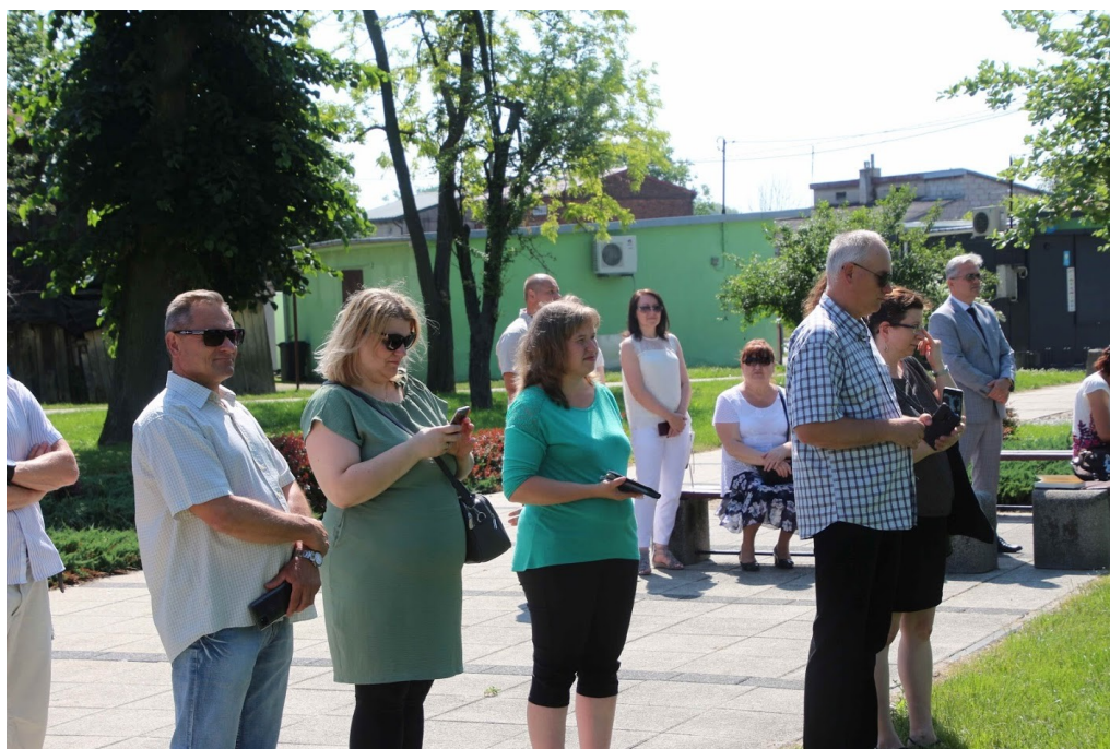
Mieszkańcy Markuszowa i okolic