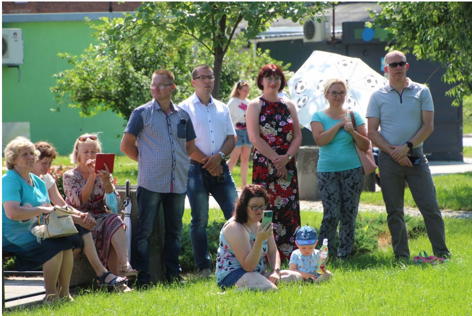
Mieszkańcy Markuszowa i okolic