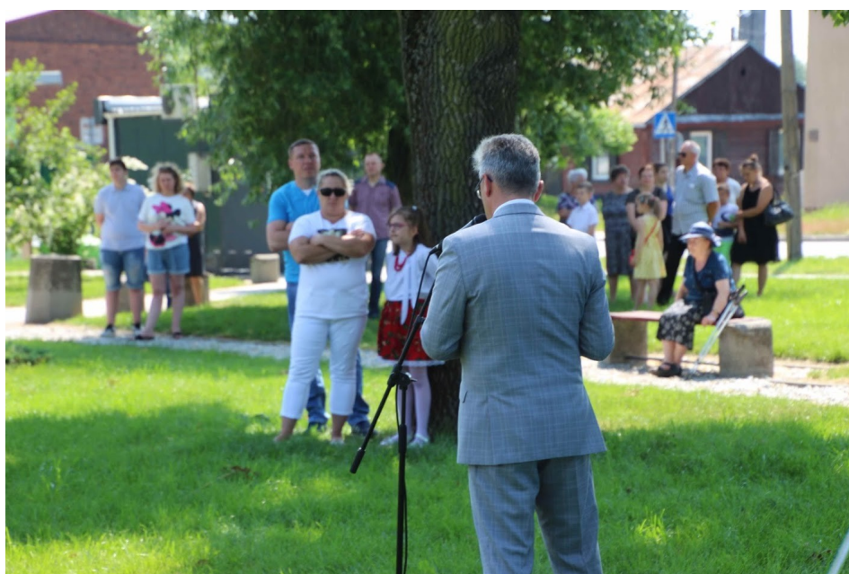
Wójt Gminy Markuszów, mieszkańcy Markuszowa i okolic