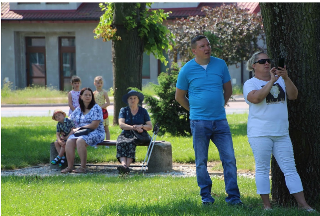
Mieszkańcy Markuszowa i okolic