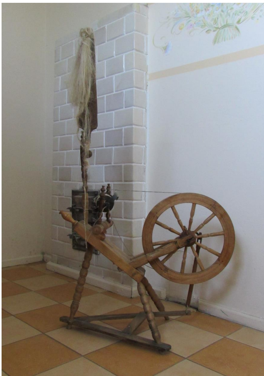
Ilustracja 22.

Potem się już przędzie na kółku, kołowrotku (Dubica). W takim domu każda z kółkiem, to gdzie, to tylko furczo te kółka (Przewłoka). Kółko było, na kółku się sprzędzie (Szóstka). No i bierzem przędziem na kółku (Sitno pow. Biała Podlaska). Później wyczesać go, dopiero prząść, prząść na kółku (Kobylany). Pu wyczesaniu już przędli, pu wyczesaniu. Przędli kółkiem. Kółkiem to było lepi, bo sobie kądziel uczepli, pumału nogo kręci (Dobryń). A później schodziliśmy się na prządki, przędliśmy ten len [...] każda z kółkiem, to tylko furczo te kółka (Uhnin). Jakaśmy byli starsze, tośmy chodzili z kółkami, przędli. Na wieczorki schodzo się dziewczyny [...]. Potem na wieczorki, kółko w garść (Lechuty Małe). Kiedyś na kółku się naprzedła, a teraz ni mogię na niego patrzeć (Huszczka). Jedne mówio na to kółko, jedne kołowrotek, a ja mówie i tak, i tak (Motwica). Na łostatku kółka pod bok, cy tam kto pirze der, cy nawet ji sydelkiem robił, ji dalej wkolo. No taka zabawa była (Jezioro). To kółka po polsku, a po mojemu kowrotok, kowrotok [...], nogo tam kręciło się te kółko i przędło się (Hołowno). A teraz już powstały takie te kółka takie. A te kółka to tak [...] jest koło, te dwie rączki, tak jakby u tygo, o, ji to koło tak przerżnięte, tu jest takie dziurki przywiercune, wsadza się to koło, jest z jednej strony jest korba, tak zwano cyganka, która się nogami robi, i to koło chodzi (Germanicha).