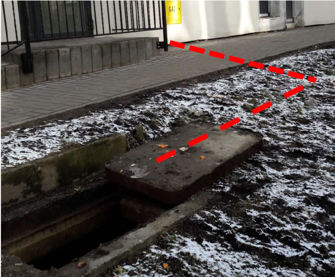
Foto 1 Sugerowana trasa projektowanego przyłącza do budynku