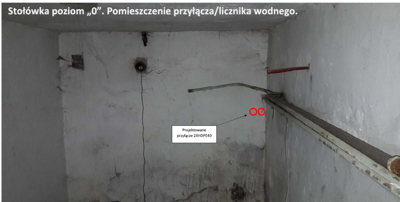
Foto 2 Sugerowane miejsce wprowadzenia przyłącza do pomieszczenia w budynku