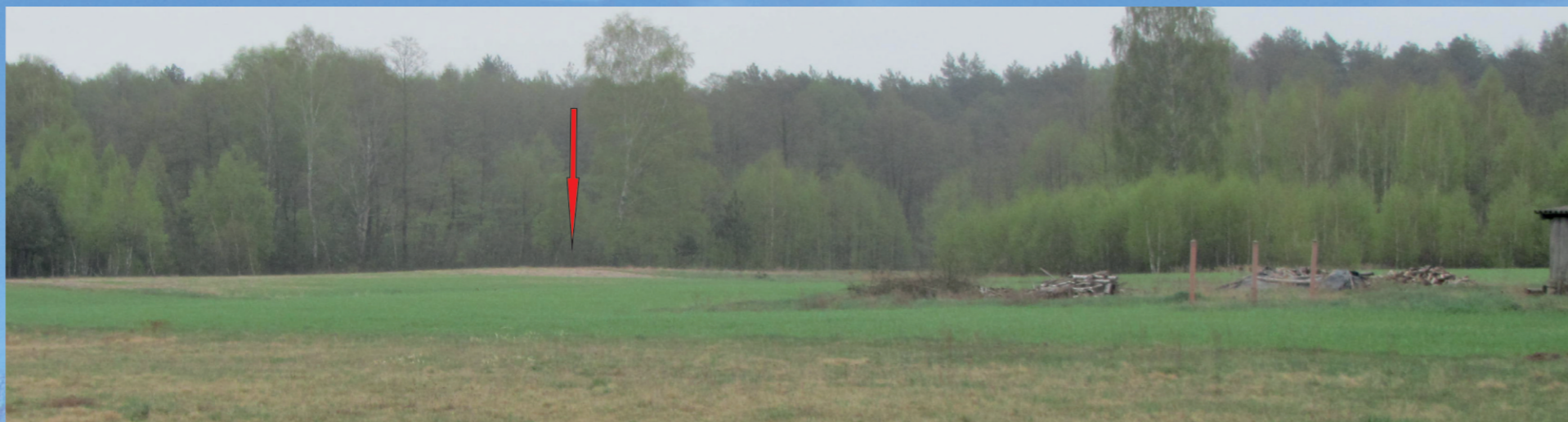
Widok na stanowisko od strony zachodniej

Publikację dofinansowano ze środków Ministra Kultury i Dziedzictwa Narodowego pochodzących z Funduszu Promocji Kultury - projekt nr 3354/18: Dubeczno, stan. 1 (Pojezierze Łęczyńsko-Włodawskie). Materiały z badań archeologicznych w latach 1986-1987