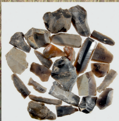
Surowce krzemienne wykorzystywane w Dubecznie l.

Do najciekawszych zabytków należą gliniane szpulki oraz tzw. przęśliki rogate (wydobyto jeden kompletny egzemplarz oraz fragment drugiego) o symbolice solarnej.