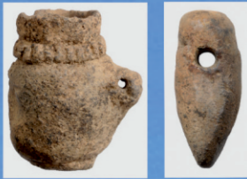
Dubeczno 1. Ceramika kultury pucharów lejkwatych.

Miejscowość Dubeczno (gm. Hańsk, pow. włodawski) leży na Pojezierzu Łęczyńsko-Włodawskim, wchodzącym w obręb Polesia Lubelskiego. Zajmuje piaszczystą „wyspę”, otoczoną od północy rozległym torfowiskiem, w którego centrum znajduje się płytkie jezioro Dubeczyńskie, zaś od południa i wschodu podmokłą i zatorfioną doliną rzeczki Krzemianki, dopływu Włodawki.