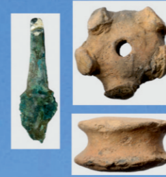
Dubeczno 1. Ceramika kultury trzcinieckiej.