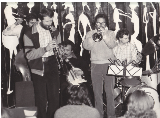
Działalność zespołów muzycznych w ACK UMCS Chatka Żaka