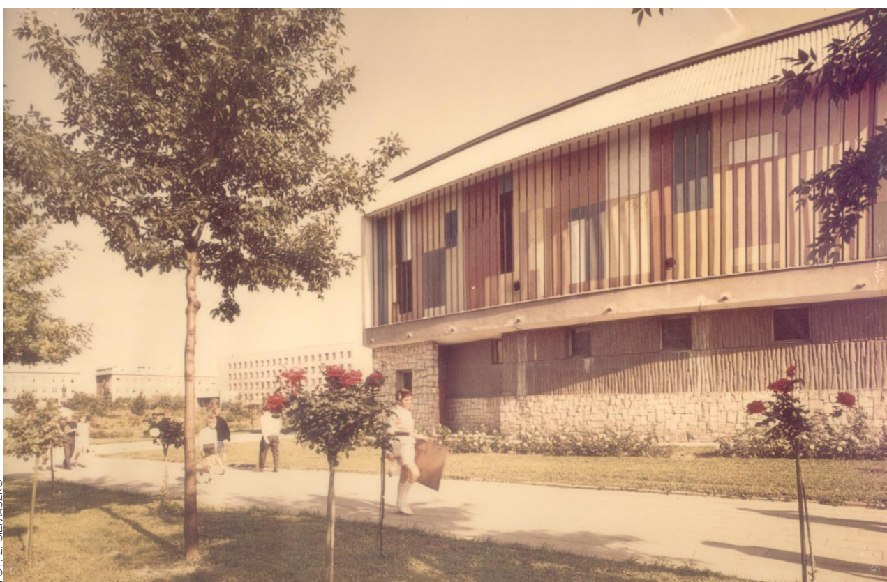
ACK UMCS Chatka Żaka lata 60. XX w.

Prezentując ponad pięćdziesięcioletnią działalność Chatki Żaka w kontekście obchodów 75-lecia istnienia