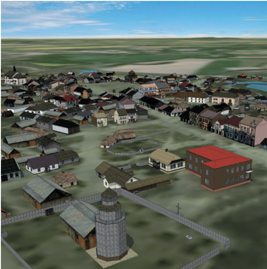
Ryc. 1. Makieta Wirtualna Bychawa 1938. J. Kuna (2017)

Idąc z duchem czasu, postępowanie badawcze przeprowadzono z wykorzystaniem nowoczesnych metod badawczych: analiz komputerowych, narzędzi grafiki komputerowej, modelowania trójwymiarowego oraz systemów informacji geograficznej (GIS) – zaliczanych obecnie do interdyscyplinarnego nurtu geomatycznej metody wspomagania badań (Kozieł 1997). Z metodologicznego punktu widzenia niniejszą publikację można także zaliczyć do obszaru badawczego geoinformacji historycznej (Szady 2008).