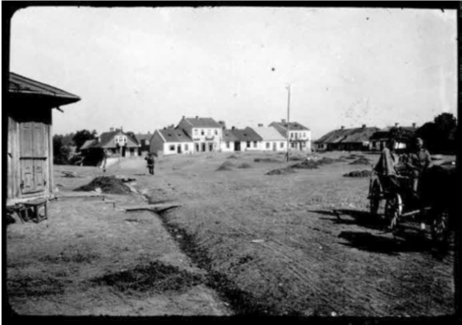
Fot. o. Rynek, zachodnia pierzeja – lata 1914–1918.

Znakiem czasu jest fakt, że przedstawione tezy doczekały się weryfikacji jeszcze przed ukończeniem składu niniejszej monografii. 22 listopada 2017 r. J. Kulik opublikował w serwisie społecznościowym dotychczas nieznaną fotografię dawnej Bychawy (fot. o). Fotografia przedstawia najsłabiej udokumentowaną, zachodnią pierzeję bychawskiego Rynku (por. s. 123). Lokalizacja miejsca przedstawionego na fotografii nie budzi żadnych zastrzeżeń, a źródło – Österreichische Staatsarchiv – pozwala określić datę wykonania zdjęcia na lata 1914–1918.