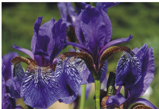
Iris sibirica L.

tel. +48 81 743 49 00, 743 49 45 tel./fax +48 81 742 67 01 botanik@hektor.umcs.lublin.pl www.garden.umcs.lublin.pl