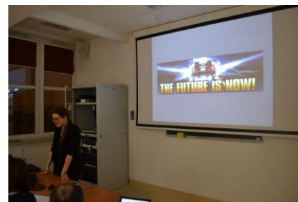
Fot. 1. XLI Debata Studencka, źródło: SKNP