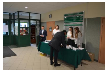
Fot. 2. Pomoc w organizacji konferencji

Zachęcamy do dalszego śledzenia działalności naszego Koła!!!