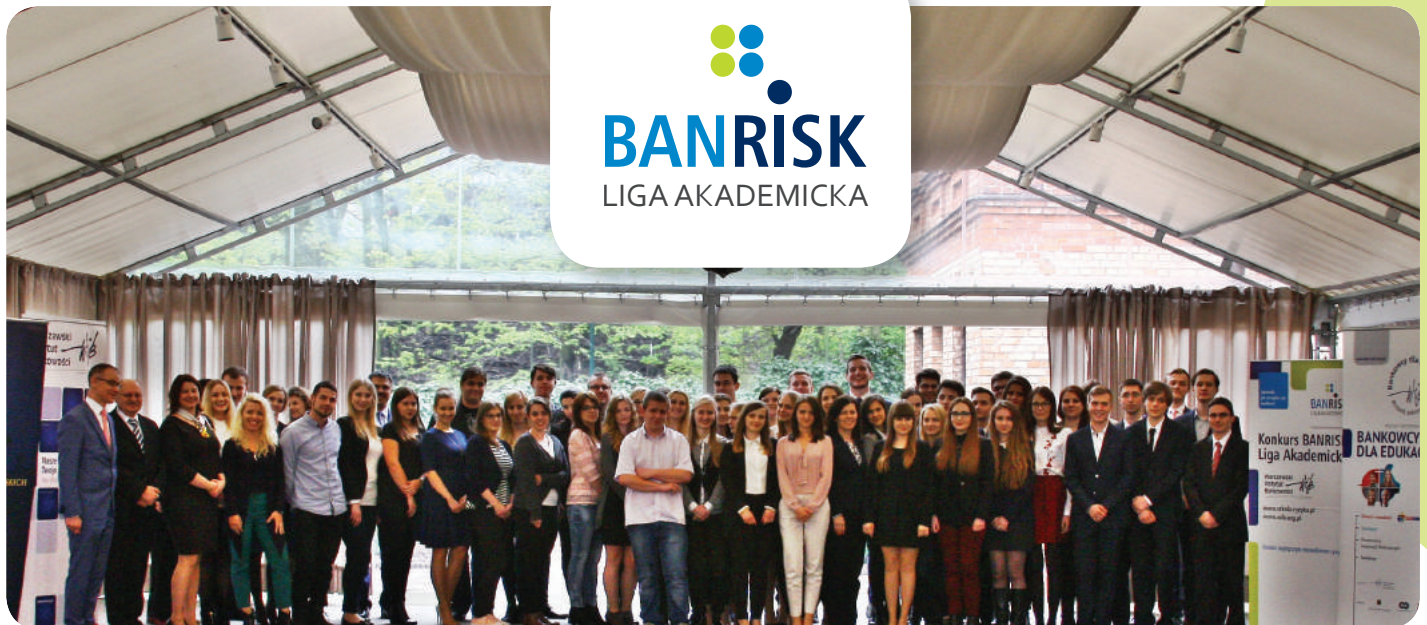
Finał BANRISK kwiecień 2017