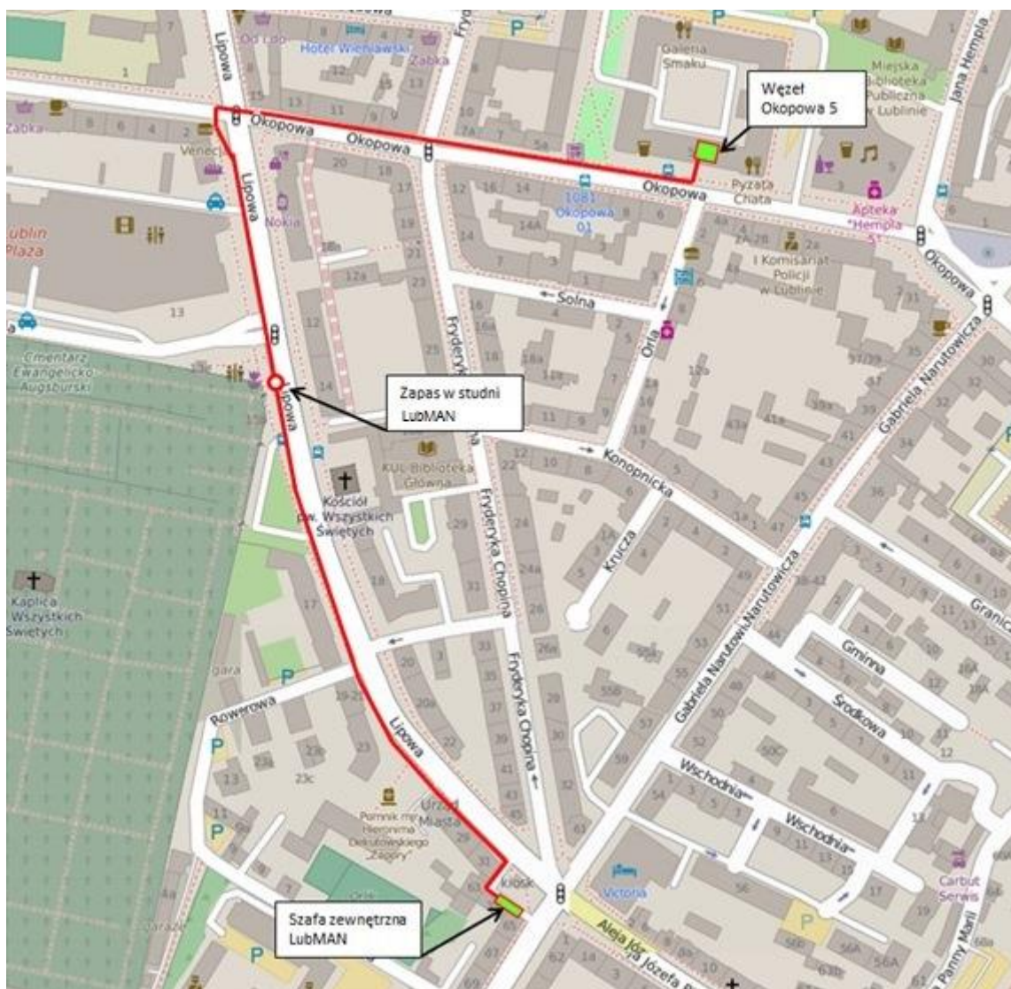
Rys. nr. 2. Schemat przebiegu kanalizacji Węzeł ul. Okopowa 5 – Szafa Lubman ul. Narutowicza 63

Po uzyskaniu zgody Spółki Orange Polska, do istniejącej kanalizacji kablowej Orange na odcinku węzeł Okopowa 5 - Węzeł LubMAN Orlen (szafa zewnętrzna LubMAN przy budynku ul. Gabriela Narutowicza 63) należy wprowadzić kabel światłowodowy 72JM bez rury osłonowej. Kabel światłowodowy należy poprowadzić poprzez nową studnię kablową SKR-1 zlokalizowaną na kanalizacji Zamawiającego, zostawiając w tej studni 30 mb. zapas kabla światłowodowego. Światłowód na obu końcach należy zakończyć przełącznicą światłowodową 1U wyposażoną w 36 kuplerów SC/APC duplex. Trasę kanalizacji kablowej Spółki Orange Polska przedstawiono na rysunku nr 2.